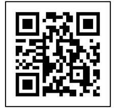
申込用二次元 バーコード

※通常の検索では出てきません。「Peatix の登録・申し込み手順」を参照下さい。