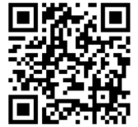
申し込み二次元コード

※通常の検索では出てきません。「peatix の登録・申し込み手順」を参照ください。