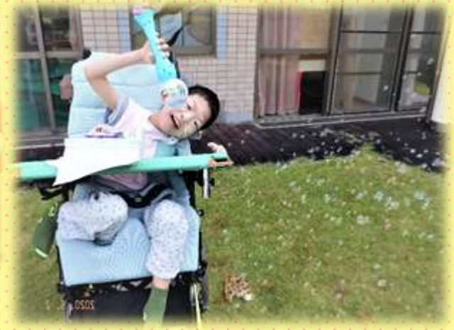
お庭でシャボン玉♪

かながわけんりつ しいりょうせんたー 50しゅうねんきねんいべんと 神奈川県立こども医療センター 50周年記念イベント