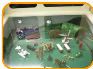
聴力検査(言語聴覚室内)