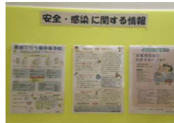
こどもの安全情報を常設展示