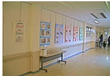
「安全フォーラム」のポスター展示